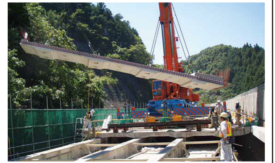
プレストレストコンクリート床版架設

損傷した床版を撤去するため、一時的に路面がなくなります。工場で作した床版の設置に続いて舗装を行い、床版取り替えが完成します。そのため、交通規制は床版取り替えと舗装の完了後に解除となります。